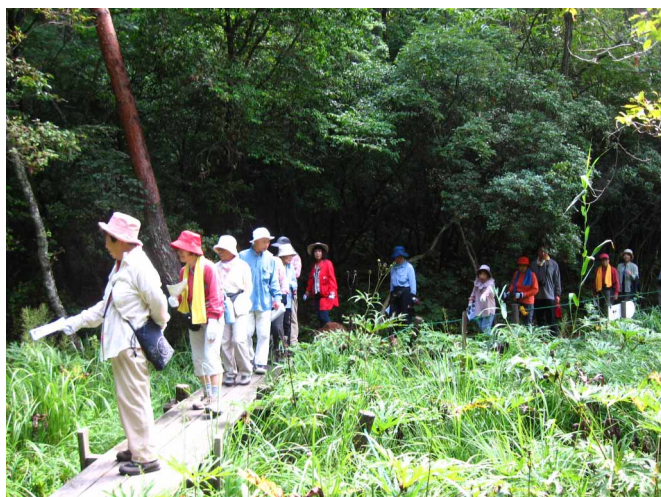
▲ ノンビリと湿原ハイキング