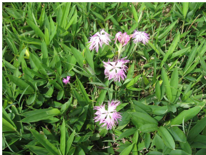
▲ 綺麗に咲いていたナadeshiko

06:00・今治発 09:00・道の駅東城 09:30・鯉が窪湿原 12:00・湿原発(昼食) 13:40・休暇村登山口 14:50・吾妻山山頂 15:20・南の原 15:50・休暇村登山口 16:00・入浴 20:30・今治着