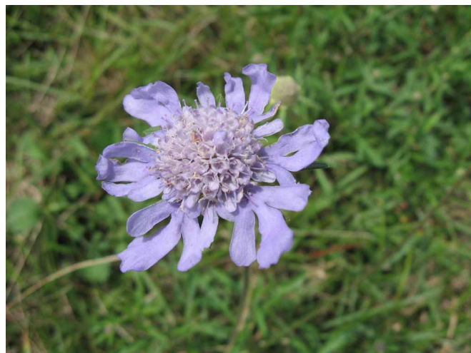
▲ ちょうど見ごろのマツムシソウ