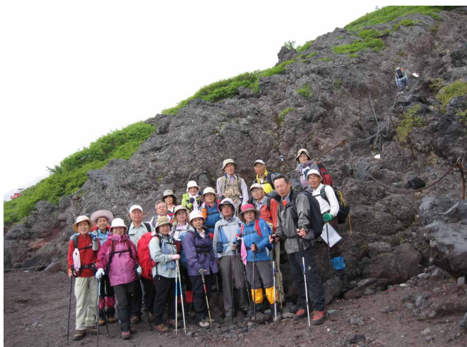
▲ 日本一の山めざしががんばります

二日目、まだ夜中の時間に起き出して、準備を整え出発。ヘッドライトに照らされる登山道と、頂上へと向かう明かりを見ながら歩いていきます。各所にある山小屋のベンチで休みを取りながら無理せず、山頂へ。途中、9合目を過ぎると、だんだんと明るくなり東の空が赤く染まり始めます。もうすぐってところで一休みを取って、みんなで御来光と対面です。澄んだ空に線引く光のすじはなんともいえない美しさです。もうちょっとを頑張って登り山頂神社へ到着。少し休んでお鉢めぐりへ、少し霧が出ていましたが、時折さーっと流れお鉢の全貌も見せてくれました。御来光も見え、天候にも恵まれ、みんなで頑張って登れた、いい富士山登山となりました。