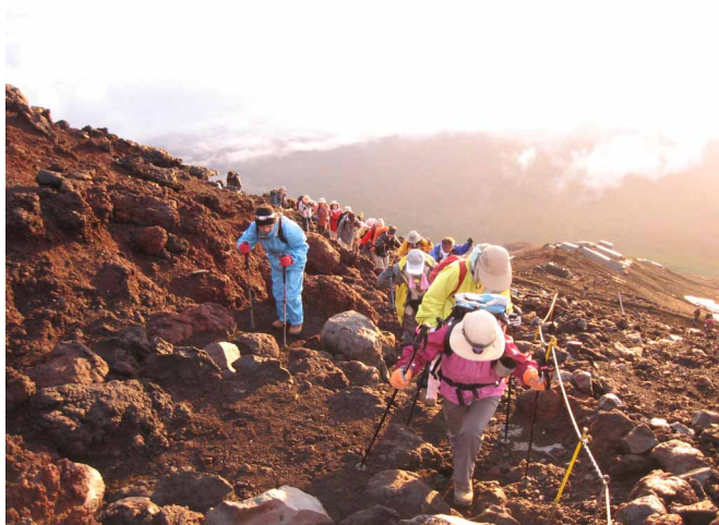
▲ 朝日を浴びて山頂へラストスパート

山開きをむかえた富士山、日本最高峰の地を目指し河口湖口から登山開始です。五合目で十分に高度順応をとり出発、なだらかな道を歩き六合目を目指します。吉田口道と合流すると、登りがきつくなって来ますが、あまり無理せずゆっくり上るのがコツと思いながら、七、八合と標高を稼ぎます。八合目を過ぎると今日の宿となる白雲荘へ到着。まだ時期が早いのでゆっくりとくつろげ、とても楽でした。