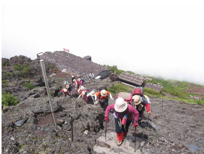
▲ ごつごつした登山道をがんばって

日本最高峰、富士山。3776mの頂めざしががんばって登ってきました。ちょうどシーズンを迎えた富士山の五合目は多くの方が詰めかけ、そんな登山者とともに出発です。すれ違う下山者の疲れた顔が気になりますが、ゆっくりゆっくり登っていきます。六合目で一休み、ここから本格的な登りとなりますが、高度順応のため焦らずいそがずです。順調に高度を稼ぎ、今日の宿八合目太子館へ到着、明日に備えてゆっくり体を休めることにしました。朝起きると、申し分のない満天の星空、ラッキーです。まだまだ暗く寒い中、山頂へ出発、多くの人に紛れ、迷子にならないように気をつけながら登っていきます。途中、休みを入れながら登りますが、酸素が薄く疲れます。5時前、東の空が明るくなり、赤い色と共に、ご来光が登ってきました。みんなで登頂祈願して最後の登りに、しかし、登山道は渋滞中！少し時間はかかったものの、最後の鳥居をくぐって山頂へ無事到着しました。天気にも恵まれ、お鉢めぐりも最高の景色を楽しむことのできた、富士登山となりました。