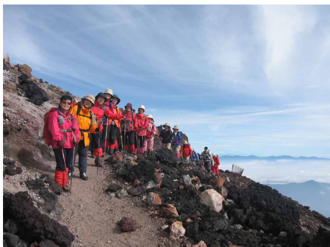
▲ 快晴の中でのお鉢めぐり

08:00・宿発 08:40・富士山レーダードーム 09:30・忍野八海(散策) 10:30・忍野発 11:30・道の駅・朝霧高原 13:00・富士IC 22:30・川内支所