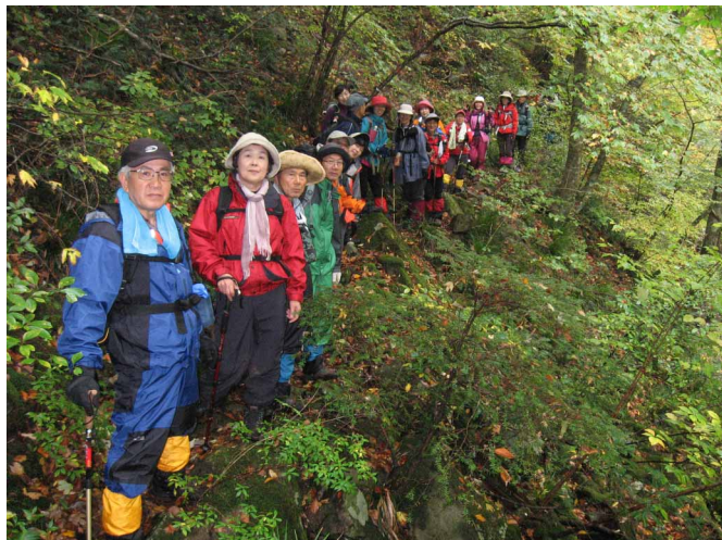
▲ 御来光の滝へ続く登山道にて

06:00・今治発 09:00・土小屋 09:30・御来光の滝展望所 10:30・溪谷堰堤 10:10・七釜 12:30・魚止ノ滝 14:40・堰堤 15:40・駐車場 19:00・今治着