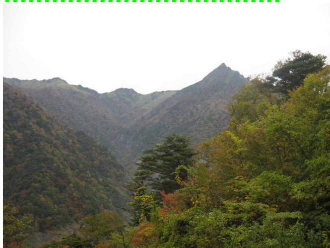
▲ 紅葉に染まる石鎚山と滝