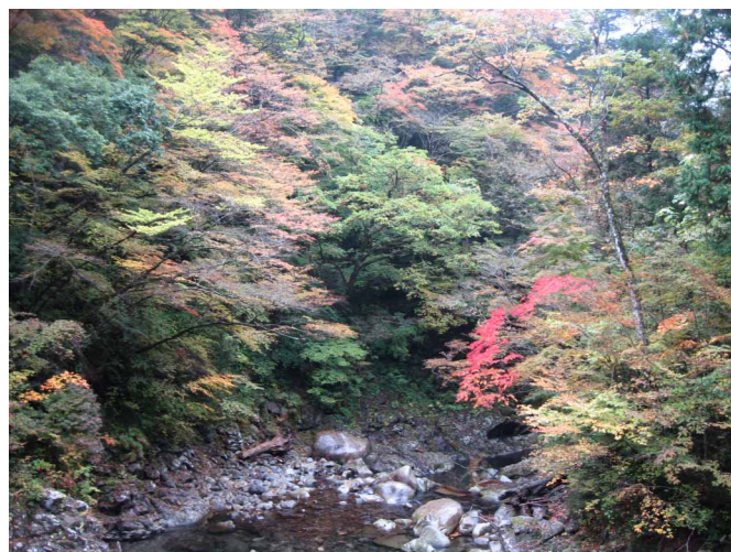
▲ きれいに色づいた紅葉達