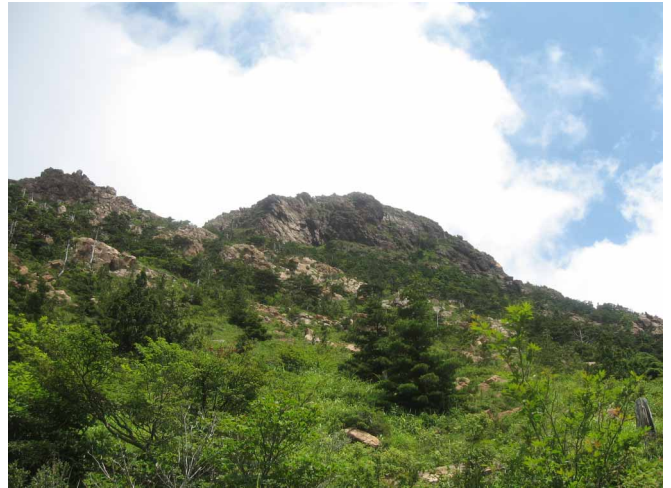
▲ 青空に浮かぶ独特な岩の山

06:00・今治発 08:30・筏津登山口 09:30・分岐 10:30・第一渡渉 12:00・赤石山荘(昼食) 13:20・東赤石山山頂 15:00・渡渉 16:00・分岐 16:40・筏津登山口 18:30・今治着