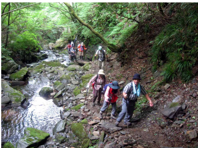
▲ 沢沿いの道をごんばって登ります

赤いカンラン岩の独特な岩山で知られる、東赤石山へ、夏の花々を楽しみに行ってきました。出発は筏津山荘から、山荘には珍しいキレンゲショウマが咲き始め、その花を楽しんで登り始めます。最初は植林帯歩き、風が通らず汗が滝のように流れます。山荘と山頂への分岐からは少し冷たい風が流れちょっと一安心。山荘コースを登って行くと、休憩の時に冷たい水で体を冷やすことができ、とても快適でした。山荘が近づくと、色々な花達が顔を見せ始めてくれ、それらを楽しみつつ山荘へ到着。ここで大休憩して、山頂へ向かいます。少し雲が出てきて天気を心配しましたが、山頂でも、もくもくした雲が浮かぶ夏の空と、青々とした夏の山並みを見ることができました。ちょっと暑い日でしたが、夏の雰囲気と沢の冷たさを楽しんだ山歩きとなりました。