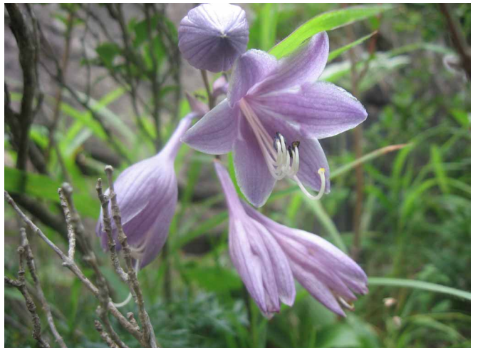
▲ 綺麗に咲いていたギボウシの花