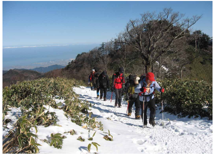
▲ 快晴の稜線を楽しみながら

06:00・今治発 07:30・石鎚ロープウェイ下谷駅 08:40・成就社 10:10・前社森 11:50・石鎚頂上(昼食) 14:00・前社森 16:20・石鎚ロープウェイ下谷駅 17:30・今治着