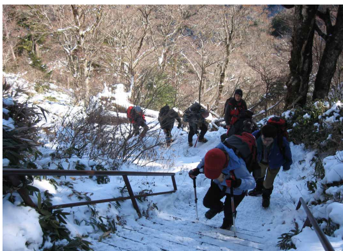
▲ 雪の積もった階段に気をつけながら