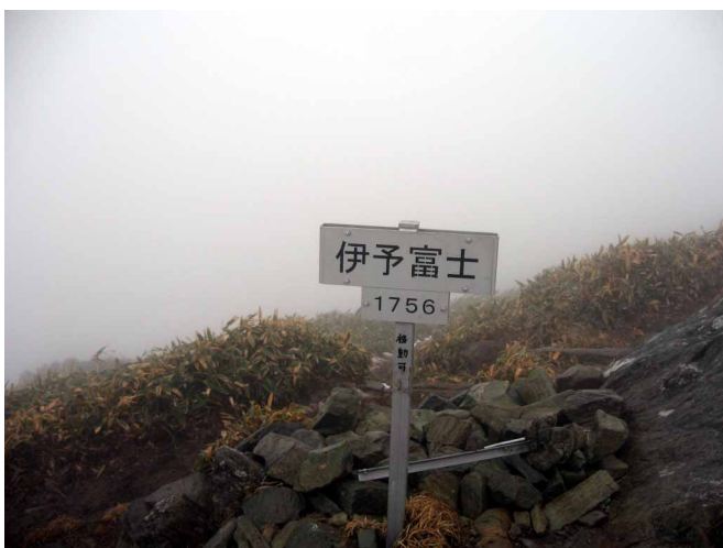
▲ 伊予富士山頂へ到着

冬の雪を楽しみに伊予富士へといってきました。スタートは旧寒風山トンネルから、最初から始まる急な登りをゆっくり上がっていきます。桑瀬峠で一息入れて稜線歩きへ、12月に入り暖かい日が続いていたからか？雪の姿があまり見当たりません。とわいえ、残っているところはガチガチに凍っているので、アイゼンをつけて慎重に歩いていきます。