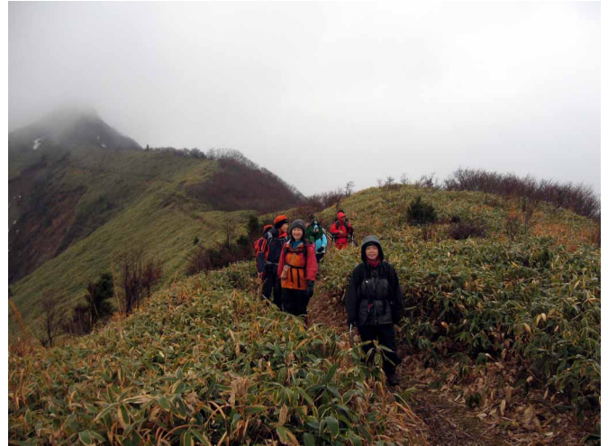
▲ 快適な笹の稜線歩き

06:00・今治発 08:00・トンネル登山口 09:20・桑瀬峠 10:30・伊予富士下広場 11:20・伊予富士山頂 12:30・稜線休憩(昼食) 14:00・桑瀬峠 15:00・登山口 17:30・今治着