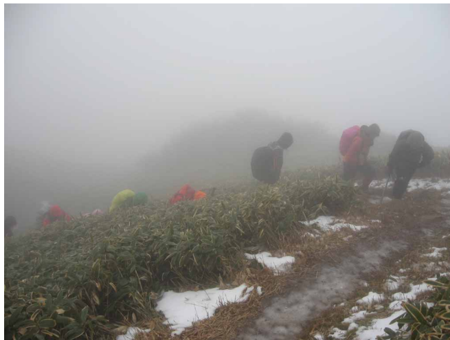
▲ 山頂直下の急登をがんばって