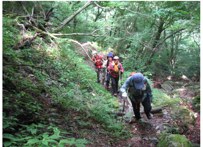
▲ 緑の世界を楽しみながら登ります