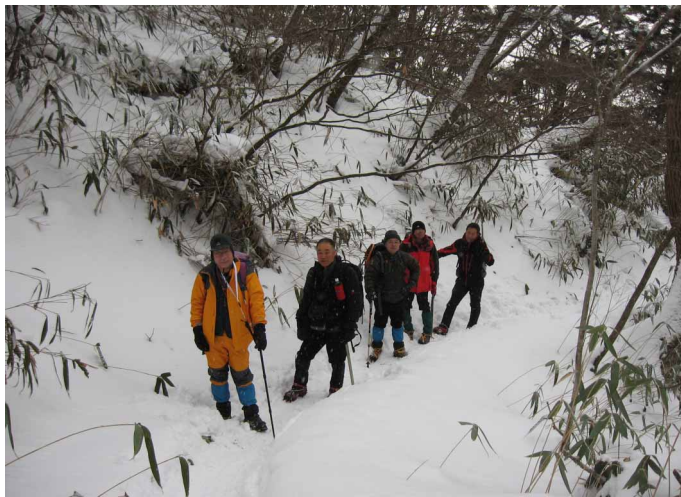
▲ 桑瀬峠までもいっぱい雪です