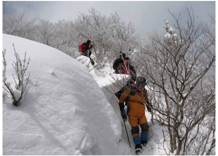
▲ 大雪の中気をつけながら歩きます

06:00・今治発 08:00・駐車場下の広場 08:45・トンネル登山口 10:00・桑瀬峠 12:00・寒風山山頂手前(昼食) 14:00・桑瀬峠 14:40・トンネル登山口 14:50・駐車場 17:00・今治着