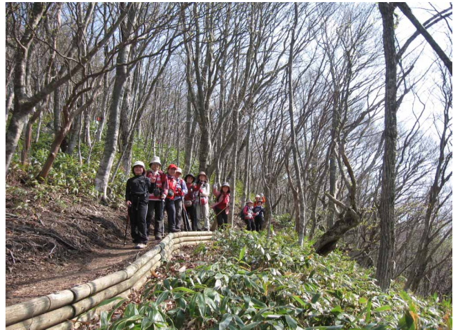
▲ 気持ちのいい自然林の登山道

山中にカタクリの花畑のある山で知られる毛無山、ちょうど見ごろとなった花達に会いに行ってきました。登山口につくと、ちょうど駐車場はカタクリ祭りという事もあり大にぎわい、快晴の天気の中をカタクリ目指して出発しました。最初は自然林のよく整備された道を歩いていきます。ジグザグな道をあがりきると、うど山の展望所に到着、気持ちのいい風が吹き、正面に大山がど〜んと見えて最高のロケーション、ここでコーヒーを飲みながら大休憩してから出発です。くらげブナと呼ばれるのブナ林を過ぎると、可愛いカタクリの花が見え始め、テンションも上昇、歩きも快調になってきます。稜線の分岐にあるカタクリの群生地は花満開、ちょうど見ごろで目を楽しませてくれました。山頂に向かう途中にあった白いカタクリの花がとっても綺麗でいい感じでした。夏のような快晴に恵まれ、ちょうど見ごろの花も楽しめた山登りでした。