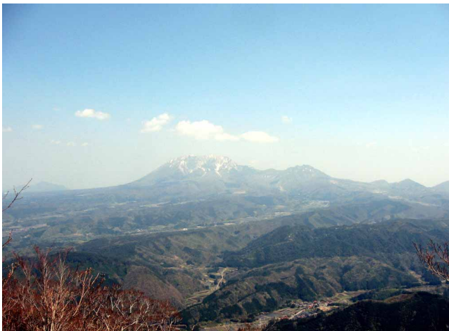
▲ 登山道から見える大山と烏ヶ山

06:00・今治発 09:00・蒜山IC 09:40・サージタンク登山口 11:00・うど山 12:00・カタクリ山広場 12:30・毛無山(昼食) 13:20・カタクリ山広場(周辺散策) 14:30・うど山 15:30・登山口 16:15・道の駅 風の家 16:50・蒜山IC 19:30・今治着