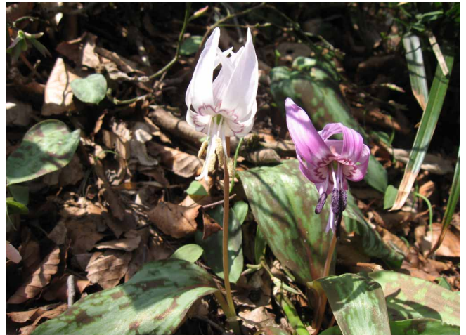
▲ 綺麗に咲いていた白いカタクリ