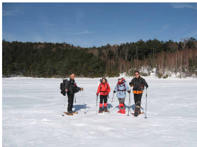
▲ 凍った白駒池の上にて

四国では体験できない、いっぱいの雪を踏んでみよう とピラタスロープウェイで白銀の世界へと登って行 きます。山頂駅から雨池峠を縞枯山へと入って急な坂 道を登りきると、赤岳を中心とする南八が白く雪をか ぶってそびえていました。天気も快晴、雲ひとつなく いい感じです。最高の景色と雪を楽しみながら茶白 山、大石峠と歩いて麦草峠へ、今日の宿、麦草ヒュッ テに到着です。暖かい薪ストーブとお茶の出迎えが最 高でした。二日目はヒュッテ周辺を散策です。森の中 を40分ほど歩くと氷結した白駒池につきます。カチ カチに凍った池の上を歩いて、池の真ん中でコーヒー タイムと、四国では信じられないような体験を楽しん できました。ヒュッテまで戻りロープウェイ乗り場 へ、前日とは違う山をまわってのんびりと歩いて 帰ります。所々の展望所から見える南アルプスや中央 アルプスの姿はなんとも言えない美しさでした。天候 にも恵まれ、雪も山も大いに楽しんだスノーシューハ イクでした。