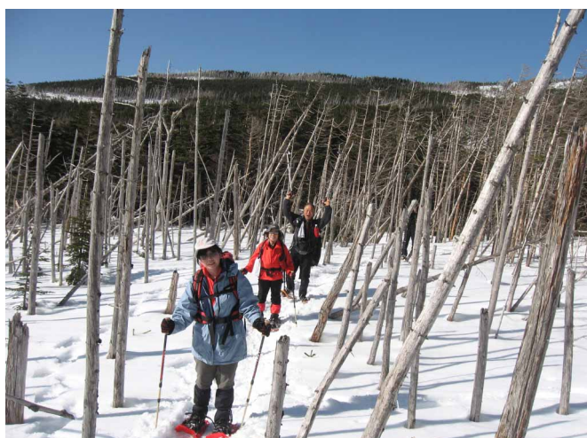
▲ 独特な縞枯れの林の中歩き

四国では体験できない、いっぱいの雪を踏んでみよう とピラタスロープウェイで白銀の世界へと登って行 きます。山頂駅から雨池峠を縞枯山へと入って急な坂 道を登りきると、赤岳を中心とする南八が白く雪をか ぶってそびえていました。天気も快晴、雲ひとつなく いい感じです。最高の景色と雪を楽しみながら茶白 山、大石峠と歩いて麦草峠へ、今日の宿、麦草ヒュッ テに到着です。暖かい薪ストーブとお茶の出迎えが最 高でした。二日目はヒュッテ周辺を散策です。森の中 を40分ほど歩くと氷結した白駒池につきます。カチ カチに凍った池の上を歩いて、池の真ん中でコーヒー タイムと、四国では信じられないような体験を楽しん できました。ヒュッテまで戻りロープウェイ乗り場 へ、前日とは違う山をまわってのんびりと歩いて 帰ります。所々の展望所から見える南アルプスや中央 アルプスの姿はなんとも言えない美しさでした。天候 にも恵まれ、雪も山も大いに楽しんだスノーシューハ イクでした。