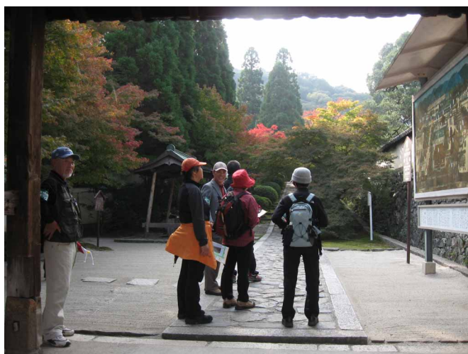
▲ 一休さんゆかりの酬恩庵へ

多くの人で賑わう京都の中心を離れ、源氏物語ゆかりの宇治と、古くから奈良と京を結ぶ要衝であった京田辺市へ、現地ガイドさんの話を聞きながら歴史ウォークへ出発です。まずは、もみじの紅葉で有名な興聖寺から歩き始めます。琴坂を下りて宇治川沿いへ、天気も良く、のんびり歩きを楽しみつつ、宇治神社から、世界遺産の宇治上神社へ到着。平安時代に立てられた最古の神社建築というだけありおごそかな感じ、ちょうど結婚式があって見学できてラッキーでした。