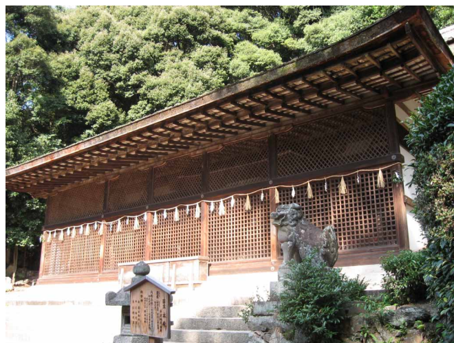
▲ 世界遺産、宇治上神社

08:00・宿発 09:00・京田辺市役所 09:40・甘南備寺 10:00・酬恩庵(一休寺) 11:50・神奈備神社 12:00・甘南備山(昼食) 13:20・市役所 13:40・観音寺 14:20・寿宝寺 15:00・田辺西IC 20:00・今治着