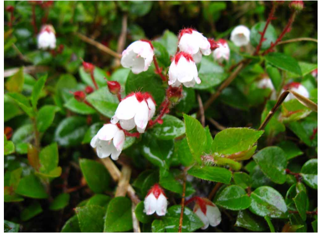
▲ 道にいっぱい咲いていたアカモノ

06:00・今治発 08:30・日浦登山口 09:20・ダイヤモンド水 10:10・歓喜坑 10:30・銅山越 12:00・西赤石山山頂 13:40・銅山越 14:30・ダイヤモンド水 15:20・日浦登山口 17:30・今治着