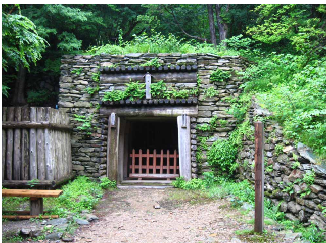
▲ かつて銅が掘られていた坑道跡

独特な山容を持つ赤石山系を西から東へ縦走しようと、日浦登山口から出発です。なぜか？天気予報に反し本降りの雨でしたが、雨具で完全防備して歩きます。最初は昔の別子銅山跡が残る道歩き、集落や学校があった石垣や、坑道を見ながら銅山越に到着です。この峠が十字路になっていて西赤石山へと向かいます。登山道沿いには、見ごろになったアカモノの花が綺麗に咲いていたり、咲き始めたコメツツジの花があったりと、楽しませてくれます。雨にぬれて濃くなった新緑のトンネルを抜け西赤石山へ到着、風雨とも強く縦走を断念。来た道を下山としました。惜しくも縦走とはなりませんでしたが、見ごろのアカモノや新緑、銅山跡の歴史を堪能した山歩きでした。