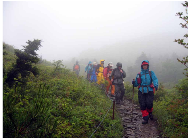
▲ 霧の中をがんばって歩きます