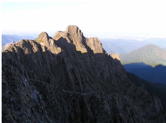
▲ 奥穂高のシンボル「ジャンダルム」