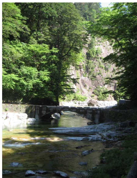
▲ 登山口までのきれいな溪谷