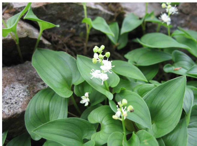
▲ 帰りに見つけたマイヅル草