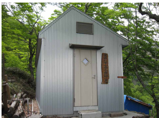
▲ 新しくなった愛大小屋