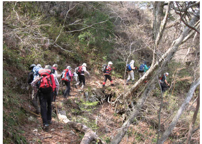
▲ 自然林の静かな登山道を歩いて