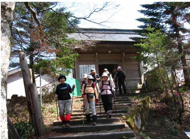
▲ 成就社の鳥居をくぐって出発