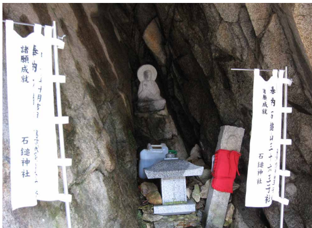
▲ 岩屋の中にひっそりある王子

石鎚王子道歩きも三回目、今回は岩屋あり石柱ありと変化にとんだ王子を尋ねてきました。