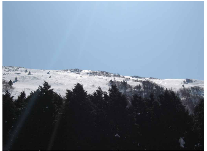
▲ 太陽光にキラキラ光る笹ヶ峰

07:00・今治発 08:40・登山口手前駐車 09:30・登山口 10:40・宿 11:30・丸山荘(昼食) 13:30・宿 15:00・登山口 15:30・駐車場 17:30・今治着