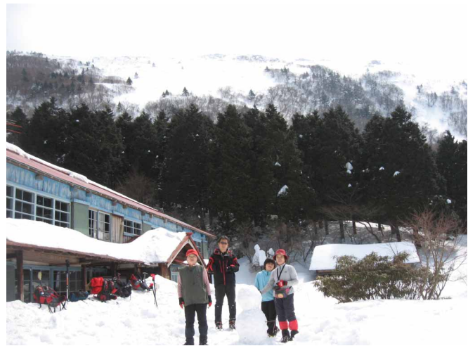
▲ いっぱい雪の積もった丸山荘にて