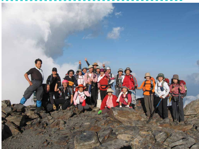
▲ がんばって歩いた蝶ヶ岳山頂にて

三日目、長壁尾根と呼ばれる急な坂を延々と下り、徳沢園に到着、上高地までノンビリと歩き長かった縦走も終了です。初日こそ雨にあいましたが、後は天気恵まれ、目的の大パノラマも存分に楽しめた山歩きとなりました。