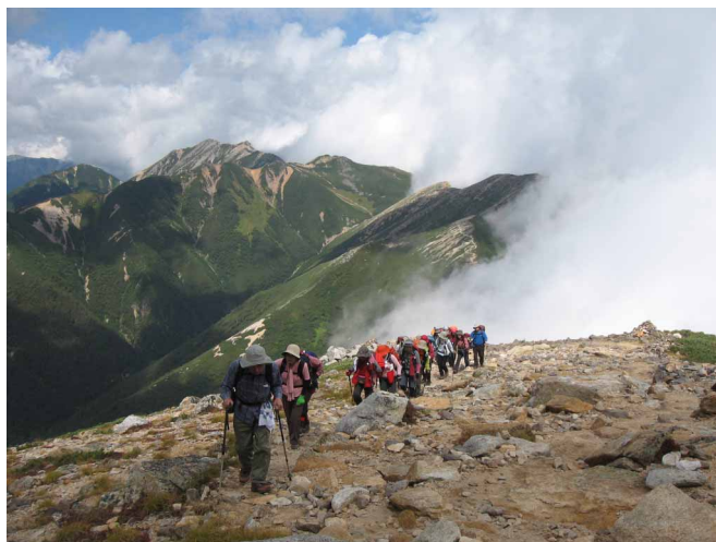
▲ 大パノラマの広がる縦走路