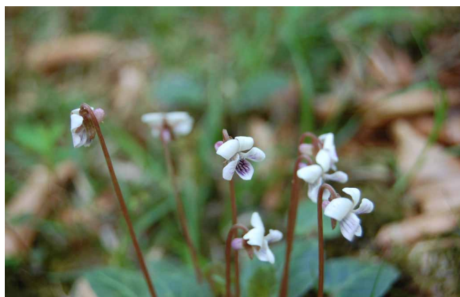
▲ 登山道に咲くかわいい花達