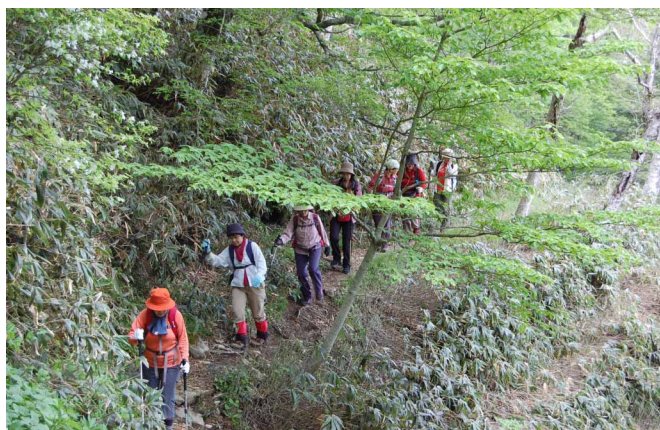
▲ 新緑を楽しみながらのんびり歩き

06:00・今治発 09:00・面河 10:00・土小屋 11:30・長沢分岐(シロヤシオ) 12:50・手箱超小屋 15:00・丸滝小屋 16:30・土小屋 20:30・今治着