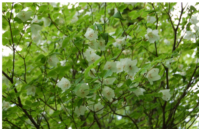
▲ 新緑の中に浮かぶシロヤシオ