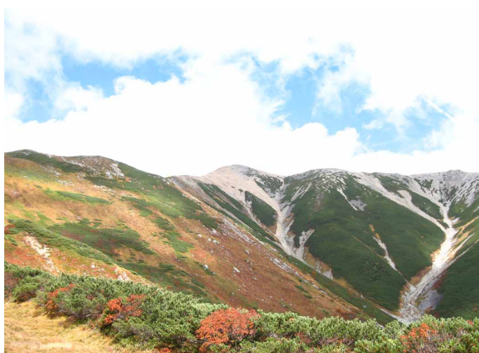
▲ 紅葉の緑に彩られる薬師岳

南北に長く伸びる堂々とした美しい山容で知られる信仰の山、薬師岳へ折立から登ってきました。最初は息の切れる急登が続きますが、だんだんだらかになり、よく整備された気持ちのいい登山道を、最高に色づいた紅葉を楽しみながら歩いていきます。いくつもの山への十字路、太郎平で一息入れて、目的の薬師岳へと向かっていきます。沢沿いの道や、なだらかな薬師平といった変化に富んだ道を歩いて、薬師岳小屋へ到着、ここから山頂まではもう一息。荷物を置いて身軽になって出発です。避難小屋のあるピークに立つと後立山の山並みから槍・穂高連峰といった雄大な山々が現れ目を楽しませてくれます。そこから程なくで歩くと山頂、薬師如来のたたずむ頂へ無事立つことができました。天候に恵まれ、雄大な山並みと大パノラマ、そしてちょうど見頃をむかえた紅葉を、存分に楽しむことができた山歩きでした。