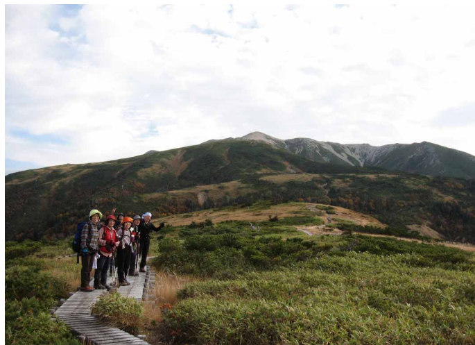
▲ 薬師岳へと続く快適な登山道