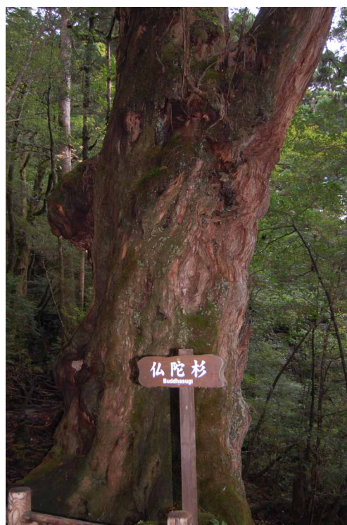
▲ 千年を超えて生き続ける屋久杉

屋久島といえば、屋久杉と多雨によって作られた、独特な緑の深い森がよく知られ、その大自然を元に作られた、「もののけ姫の」舞台と巨樹の森を訪ねてきました。