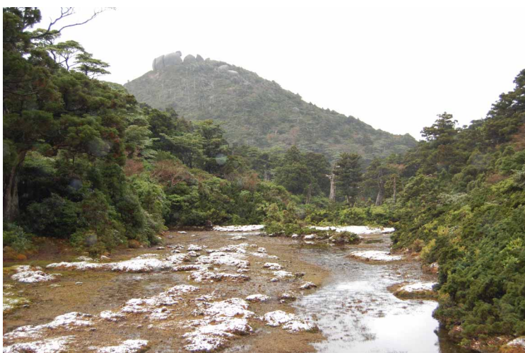
▲ 雪に覆われた小花之江河