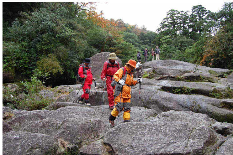
▲ 花崗岩の大岩を越えて

今回は、思わぬ雪景色と世界自然遺産にふさわしい屋久島の大自然を、いっぱい楽しんだ山歩きとなりました。