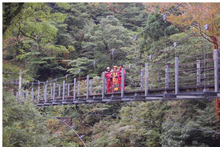
▲ 吊り橋から望む「絶景!!」