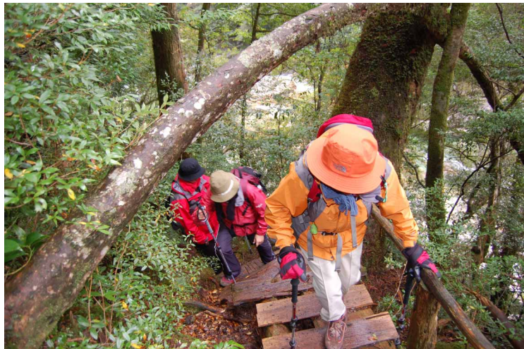
▲ 屋久島の緑の濃い登山道歩き

05:00・民宿発 06:00・淀川登山口 08:00・淀川小屋 10:30・小花之江河 11:00・花之江河 13:30・淀川小屋 15:00・淀川登山口 16:30・民宿一泊