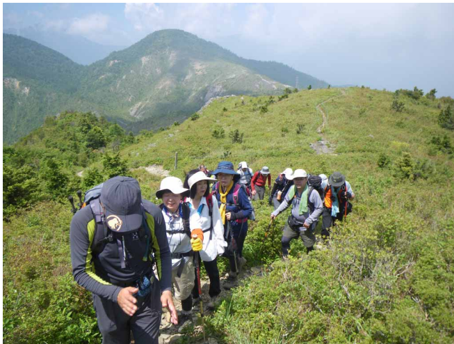
▲ 快晴の中、縦走路を歩いて