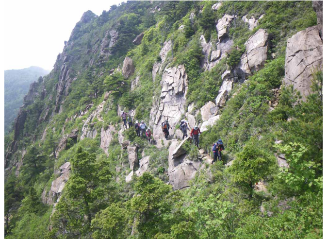
▲ 岩の道を、気をつけつつ

06:00・今治発 08:00・日浦登山口 10:00・銅山越 11:30・西赤石山 12:40・物住頭 14:00・赤石山荘 15:00・東赤石山 17:20・渡渉分岐 18:20・筏津登山口 20:30・今治着