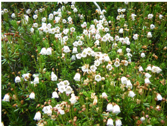
▲ 可愛い花を咲かせていたツガザクラ