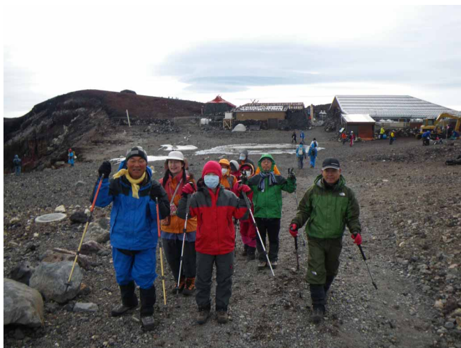
▲ お鉢を周歩いて最高峰へ向かいます

夏のわずかな時間しか登ることができない富士山、日本最高峰を目指して登ってきました。