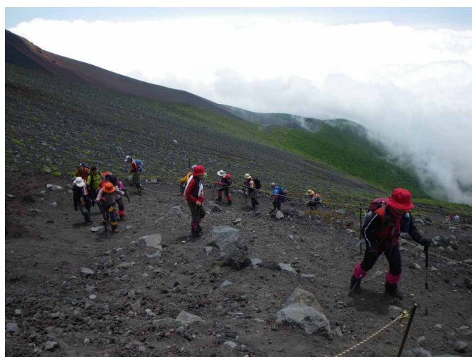
▲ 山頂まで続く道をゆっくりと上へ

まだ、夜中といってもいい時間に、ヘッドライトの明かりを頼りに出発。山頂まで続くライトの列に加わって登っていき、大きな鳥居をくぐると、お鉢に到着。ちょうど、夜が開け始め、東の空を赤く染め上げるご来光が美しく輝き、疲れましたが最高のご褒美でした。一息入れて、最高所の剣ヶ峰へ、最高峰と書かれた石碑の前にて記念写真で締めくくってきました。心配した天候も、予報に反しい方向に回復し青空の中を快適に歩き、ご来光も見えたいい山歩きとなりました。