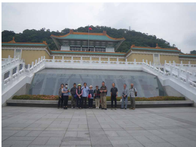
▲ 故宮博物館にて秘宝を満喫