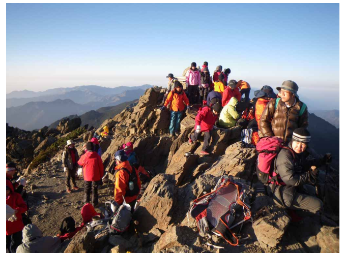
▲ 多くの人で賑わう玉山山頂

3000mを越える山を200以上持つ南海に浮かぶ台湾、その山岳にそびえる最高峰、玉山の頂を目指してきました。広島空港を飛び立った、チャイナエアラインは順調に台北へと降りたち、山岳ガイドさんと共に登山のベースとなる阿里山へと向い、初日はここで一泊。二日目、登山口へ向う前、登山オフィスで入山チェックを受けて出発、塔々加鞍部から歩き始めます。南国の日差しが痛い中、切れたった岩肌を見せる玉山山系の山並みと花々を楽しみつつ高度をゆっくり上げていきます。3000mを越えると空気が薄くなってきます。高山病に気をつけながら努めてゆっくり！こまめに休憩を取りつつ、排雲山荘に到着です。ここで翌朝に備えて早めの就寝としました。三日目、2時過ぎヘッドライトの光を頼りに出発、満点の星空が最高です。よく整備された登山道をゆっくり進んで行きますが、山頂までの2kmが長く感じられました。傾斜をました岩場を登りきると3952m玉山山頂到着です。朝日に染まる峰々と玉山が作り出す山陰が美しく圧巻でした。山頂からは一路来た道に戻り、この日の宿がある嘉義の街へ向い登山終了。