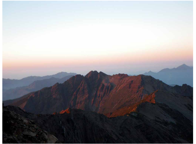
▲ 朝日に染まる玉山山系の山並み