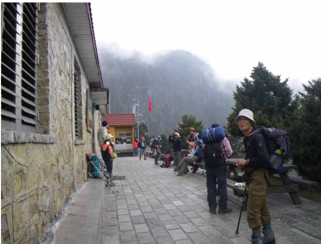
▲ 玉山のベースとなる排雲山荘へ到着

3000mを越える山を200以上持つ南海に浮かぶ台湾、その山岳にそびえる最高峰、玉山の頂を目指してきました。広島空港を飛び立った、チャイナエアラインは順調に台北へと降りたち、山岳ガイドさんと共に登山のベースとなる阿里山へと向い、初日はここで一泊。二日目、登山口へ向う前、登山オフィスで入山チェックを受けて出発、塔々加鞍部から歩き始めます。南国の日差しが痛い中、切れたった岩肌を見せる玉山山系の山並みと花々を楽しみつつ高度をゆっくり上げていきます。3000mを越えると空気が薄くなってきます。高山病に気をつけながら努めてゆっくり！こまめに休憩を取りつつ、排雲山荘に到着です。ここで翌朝に備えて早めの就寝としました。三日目、2時過ぎヘッドライトの光を頼りに出発、満点の星空が最高です。よく整備された登山道をゆっくり進んで行きますが、山頂までの2kmが長く感じられました。傾斜をました岩場を登りきると3952m玉山山頂到着です。朝日に染まる峰々と玉山が作り出す山陰が美しく圧巻でした。山頂からは一路来た道に戻り、この日の宿がある嘉義の街へ向い登山終了。