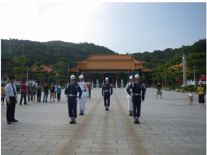
▲ 忠烈祠で衛兵交代を間近で見学