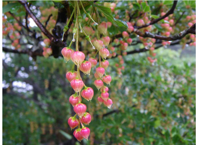
▲ 色鮮やかな花をつけたドウダンツツジ

06:00・今治発 08:00・東黒森山林道入口 09:00・東黒森 10:30・伊予富士 11:30・稜線(昼食) 12:30・桑瀬峠 13:30・旧トンネル登山口 16:30・今治着