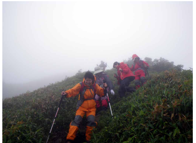
▲ 伊予富士からの下りを気を付けながら