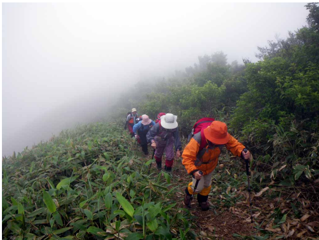
▲ 笹原の縦走路を歩いて東黒森へ