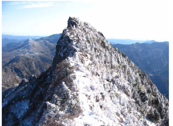
▲ 雪化粧してそびえる天狗岳