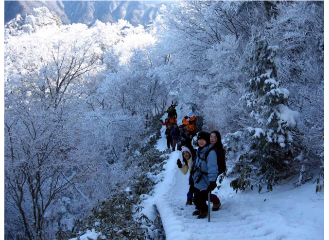
▲ 霧氷と雪に彩られた登山道

06:00・今治発 07:40・石鎚ロープウェイ下谷駅 08:40・成就社 10:30・前社森 11:20・夜明峠 12:30・石鎚山山頂(昼食) 15:00・前社森 16:20・成就社 16:50・石鎚ロープウェイ下谷駅 18:30・今治着