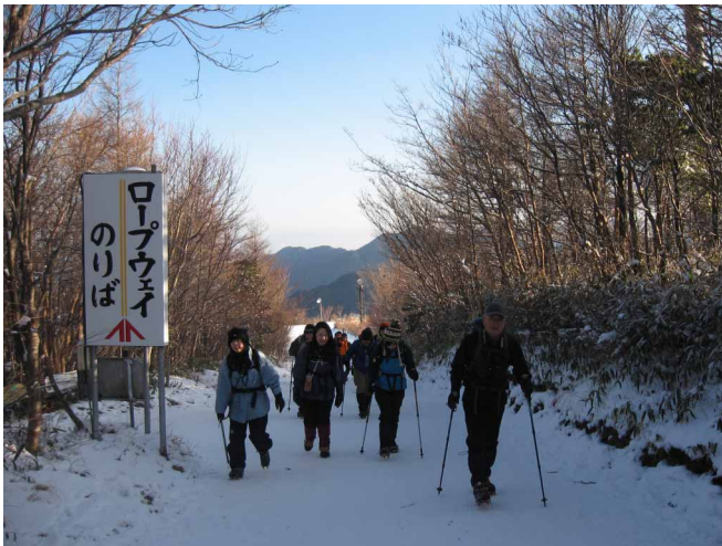
▲ ロープウェイを下り成就社へ