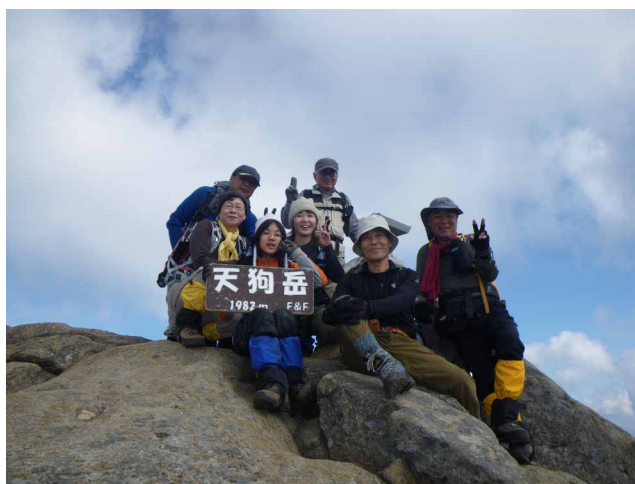
▲ 岩場を頑張って登って天狗岳へ

本格的な冬の訪れを前に、秋の景色を楽しんでみようと、石鎚山へ土小屋から山頂目指して登りに行ってきました。