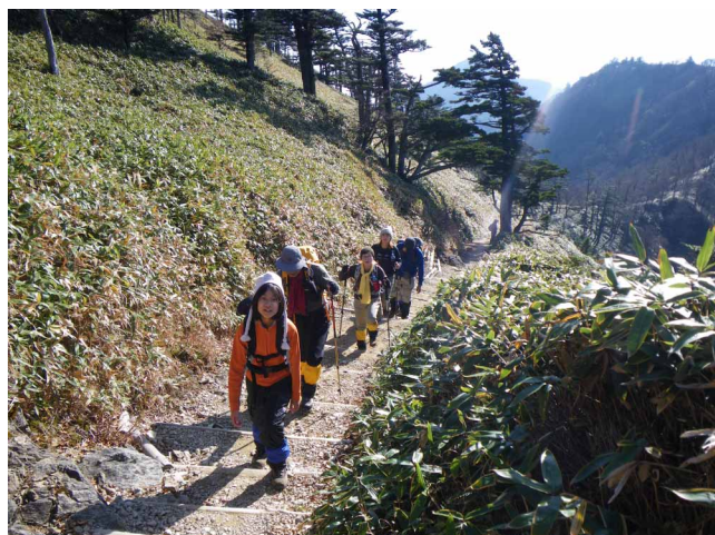
▲ 暖かい日差しを受けながら出発