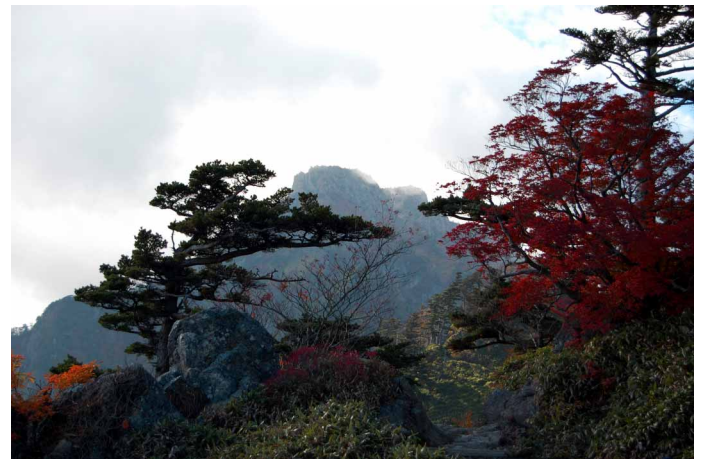
▲ 堂々と立つ石鎚山の景色