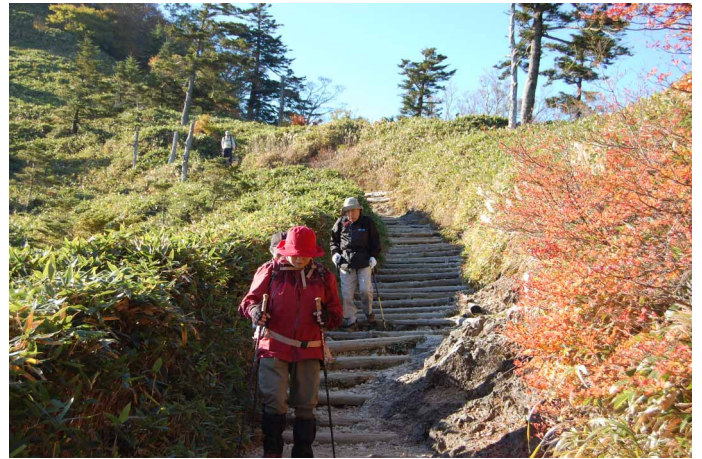
▲ 山並みと紅葉を楽しみながら

06:00・今治発 08:40・面河バス停 09:30・土小屋登山口 10:30・ベンチ 11:30・二の鎖鳥居分岐 12:30・石鎚山山頂 13:30・二の鎖鳥居分岐 15:30・土小屋 19:30・今治着