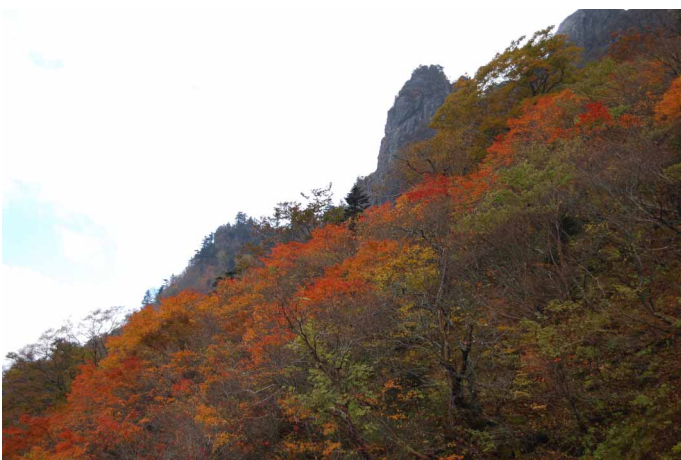
▲ 岩稜を染め上げる鮮やかな紅葉

この次期には綺麗な紅葉美で話題にのぼる石鎚山ですが、今回は土小屋から、もみじ狩りを楽しみつつ登ってきました。