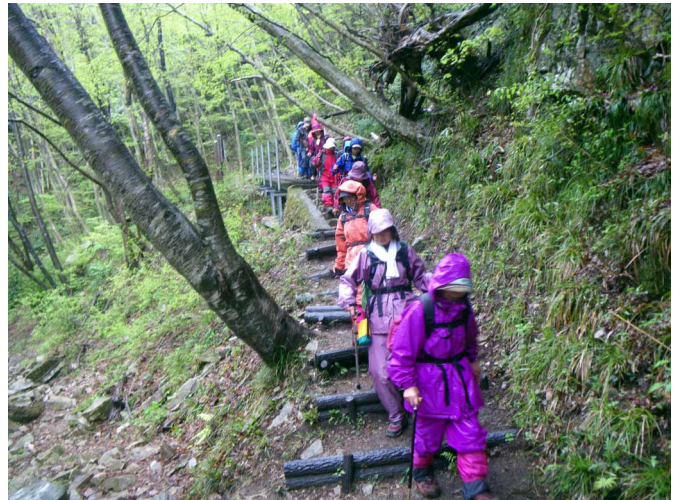
▲ 雨で色が濃くなった新緑の道