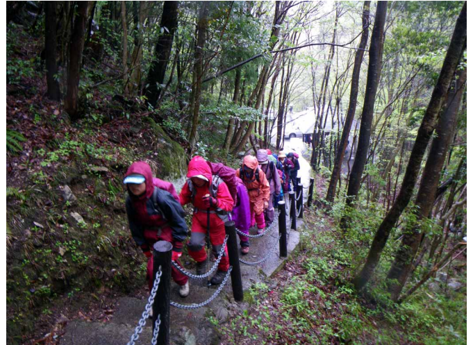
▲ 溪谷沿いを歩いていきます

06:00・今治発 09:00・吉和IC 09:30・寂地峡駐車場 11:20・犬戻ノ滝 12:00・林道登山口 13:00・休憩所(昼食) 15:00・駐車場 15:30・温泉 16:20・吉和IC 19:30・今治着