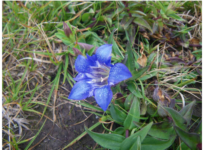
▲ 伊吹山に咲いていたリンドウ

06:00・今治発 08:30・瓶ガ森駐車場 09:20・子持権現山下 11:00・シラサ峠(昼食) 12:00・伊吹山入り口 12:30・伊吹山山頂 13:30・よさこい峠 14:30・寒風茶屋(休憩) 17:00・今治着