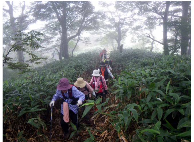
▲ 霧の立ち込めるブナ林あるき