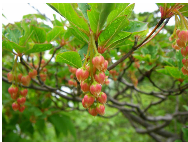
▲ 可愛い花を付けたドウダンツツジ

石鎚山系でも有数の景色を楽しめる道を歩いてみると、寒風山から笹ヶ峰へと縦走してきました。前日の夏の太陽はどこへやら、出発する時うっすらと曇る梅雨の空模様でしたが、寒風山の旧トンネルへ着く頃には、青空も少し見えて安心の出発。桑瀬峠を越えて、一路、寒風山を目指します。なんとも蒸し暑く感じる中、一汗も二汗もかいて寒風山へ到着、虫の多い山頂は早々に撤退し、笹の登山道を下っていきます。湿度のおかげで色濃くなった緑を眺めたり、ドウダンツツジやコメツツジを観察したり楽しみながら笹ヶ峰到着です。ここで昼食と思ったら、突然の雨！そうそうに下山すると、また良くなる天気??でも、雨が抜けるときに見せてくれた雲海と霧が山々を巻く景色は絶景でした。あいにくの空模様でしたが、雨にもあまりあたらず、大いに楽しめた縦走路歩きでした。