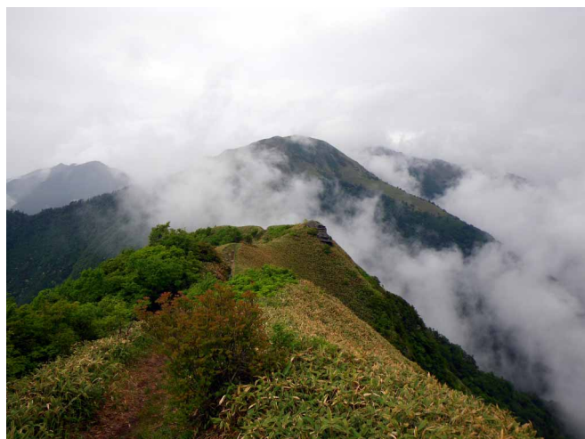
▲ 笹ヶ峰へと続く縦走路

06:00・今治発 07:50・トンネル登山口 08:40・桑瀬峠 10:00・寒風山 12:00・笹ヶ峰 13:30・丸山荘(昼食) 14:20・宿 15:00・林道登山口 17:00・今治着