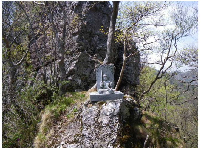
▲ 登山道に祭られた石造

06:00・今治発 08:00・南国IC 10:00・高板山登山口 10:30・林道ゲート 11:40・四国石 12:00・高板山(昼食) 14:10・登山口分岐 14:40・登山口 16:30・夢の温泉 17:30・南国IC 19:30・今治着