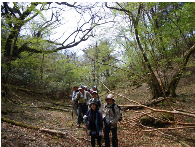
▲ 森林浴を楽しみながら歩いていきます