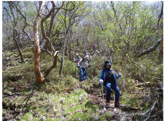
▲ ちょっと急な坂道も頑張って