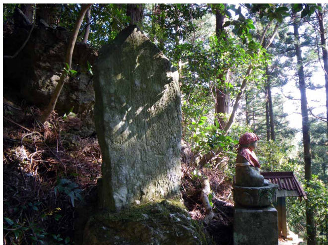
▲ 登山道沿いに残る立派な石碑