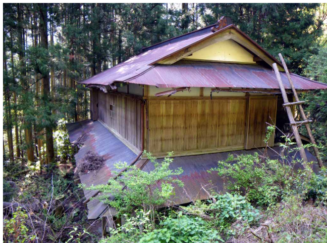
▲ 黒川集落に残る大きな家

06:00・今治発 07:40・虎杖登山口 08:30・黒川集落 10:20・行者堂 12:20・石鎚成就社(昼食) 13:30・今宮道入り口 14:40・今宮集落跡 16:00・河口登山口 17:30・今治着