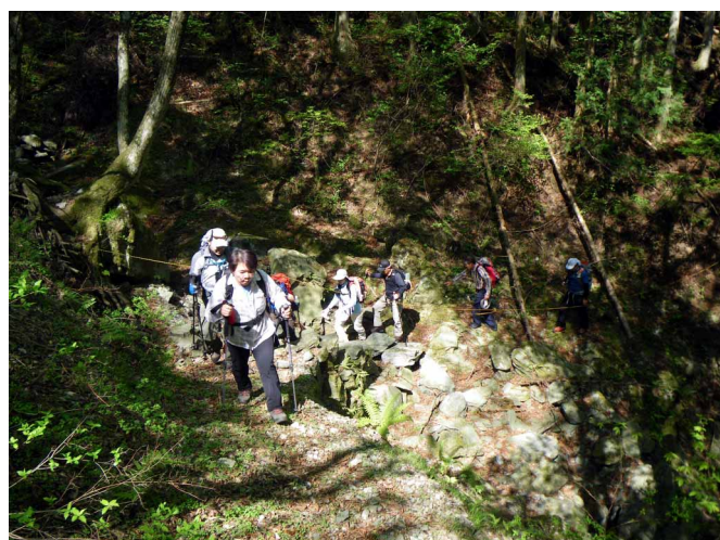
▲ 多くの人々が行き来した道を歩いて

ロープウェイができるまでは、石鎚山への参拝の道で栄えた黒川道と今宮道、昔は多くの人も住んでいたという集落跡とともに訪ねてきました。河口から少し入った虎杖からスタート、歩きやすい歩道が続きます。黒川集落の手前には立派な石碑と灯籠が残り参道の雰囲気の色濃く残っています。今でも大きな家々が残る黒川集落を後にして、植林帯の中を抜けると自然林の綺麗な登山道へと変わっていきます。ちょうど新緑の季節で黄緑の鮮やかな色が綺麗でした。川音が近くなり開けた場所に出ると行者堂、もう建物は残っていませんが石碑がたたずんでいます。行者堂から川沿いの道を歩き、途中から谷を登ると成就社へはあと一息です。成就社におまいりして、帰りは今宮道を河口へと下りました。快晴の心地よい天気の中、昔の村々と参道を巡る歩きを楽しんできました。