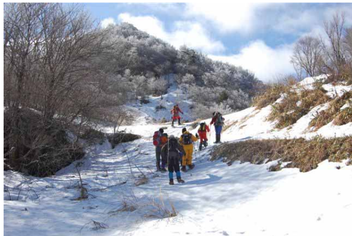
▲ 青空に向かって登っていきます

06:00・今治発 08:30・道の駅みかわ 09:00・美川スキー場 12:00・美川峰 12:30・美川峰下広場(昼食) 15:00・美川スキー場 15:30・道の駅 18:00・今治着