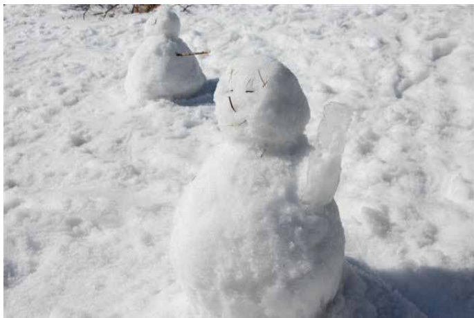
▲ みんなで作ったスノーマン