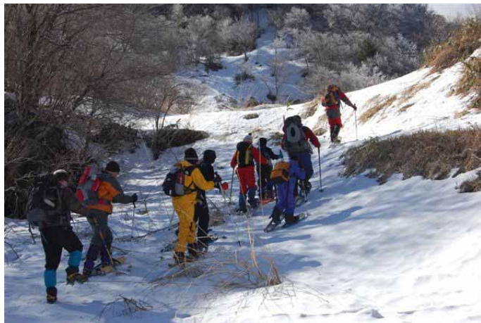
▲ 誰も歩いてない雪原歩きへ