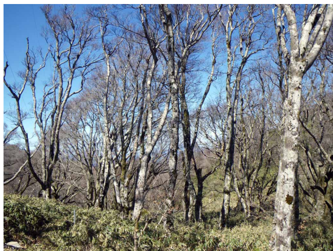
▲ 青空に浮かぶ美しいブナの木立