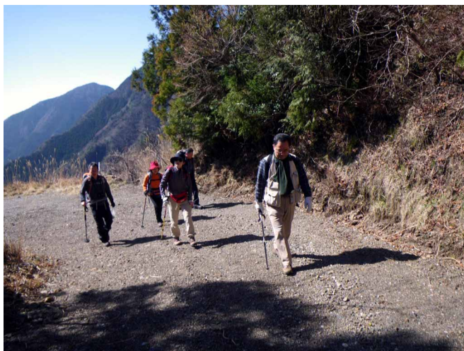
▲ 最初は林道を歩いて登山口へ