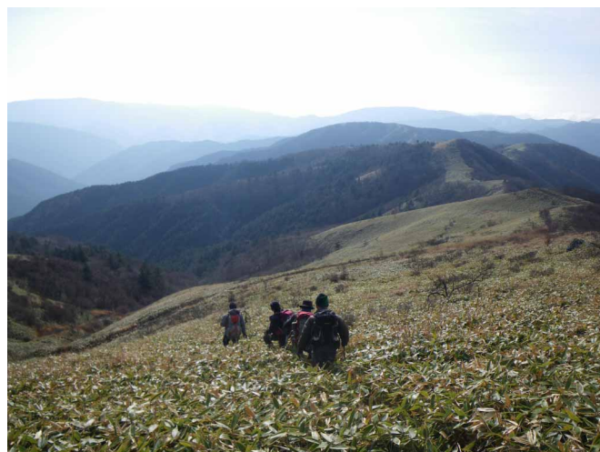
▲ 笹原の中をノンビリと散策