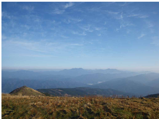
▲ 遠くに浮かび上がる石鎚山系の峰