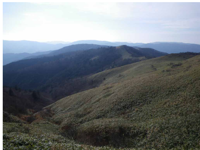
▲ 太陽に照らされ輝く笹原