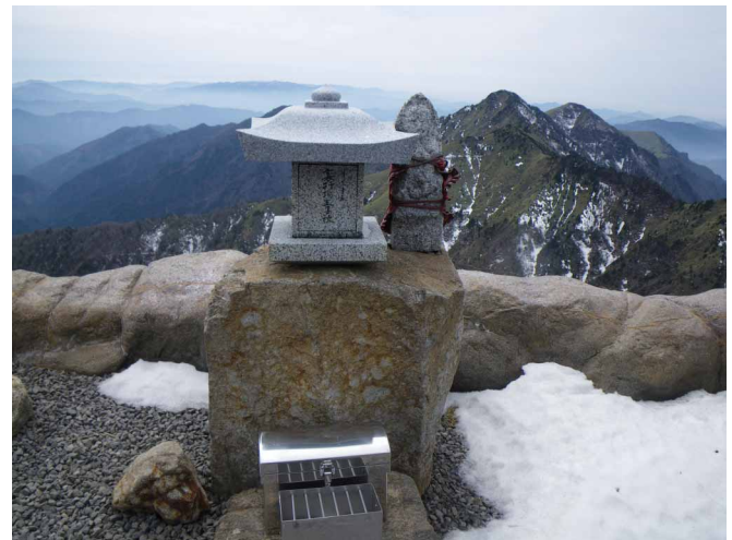
▲ 神社横にひっそりある王子社

石鎚山へ三十六ある王子をめぐりながら登る修験の道歩き、その最終回へと行ってきました。成就社を過ぎ八丁坂から急な坂を上ると、ためしグサリです、普段なら巻き道を通るところですが、この上にある王子へお参りするため、鎖にしっかりつかまりながら慎重に登っていきます。王子社と横に立つお地藏様にご挨拶、突き出すようにたつ岩場からは、山頂もよく見えていました。前社森から大剣、小剣、古森、早鷹王子と巡り夜明峠に到着。峠を越えると、多くの雪が残っていてアイゼンを付けて登って行きます。二の鎖場からはトラバース道や雪に埋まった階段を慎重に越えて山頂に到着、王子へお参りしました。山頂からは晴天の空に浮かび上がる石鎚山系の山並みが見渡せ綺麗でした。昼からポカポカ陽気で暑いぐらい、春の訪れを感じられる山歩きを楽しんできました。