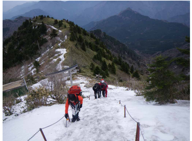
▲ 二の鎖からは雪景色です