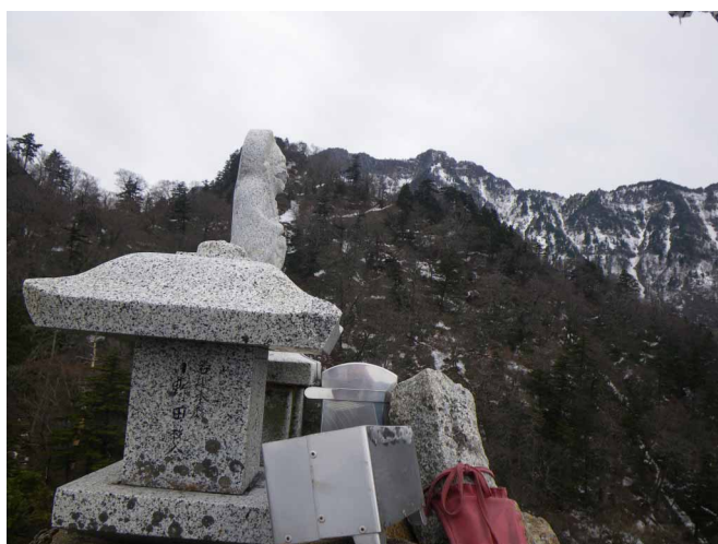
▲ ためしグサリの上にある王子社