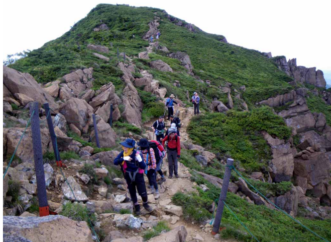
▲ 蛇紋岩の独特な岩稜を歩き至仏山へ

春から多くの花々を楽しめる場所として知られる尾瀬、尾瀬沼を挟みどっしりそびえる至仏山、燧ヶ岳と共に歩に行ってきました。