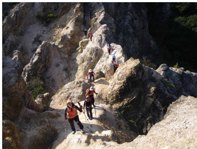
▲ 須磨アルプスの馬の背を越えて

二日目、大龍寺から市ガ原へ、ここから摩耶山へのキツイ登りの始まり、頑張って登れば快晴の空がまっていました。山上の道を、記念碑台、ガーデンテラスと通り抜け最高所へ、ここで水分を補給し宝塚へ下ります。歩きやすい山道を自然林の紅葉を楽しみながらラストスパート、暗くなる前に塩尾寺へ到着で完歩しました。12月と思えない、暖かい日に恵まれ大縦走を頑張って歩けたいい山歩きとなりました。