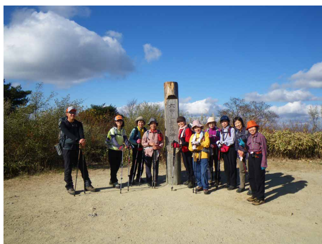
▲ 澄み渡る快晴の六甲山最高所

六甲山系を須磨から宝塚へと貫いて歩く全山縦走路、50kmを越える道を2日で歩いてきました。