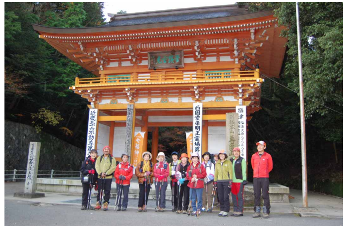
▲ 縦走路沿いに立つ大龍寺にて

06:00・宿発 06:40・大龍寺 07:30・市ガ原 11:30・摩耶山 11:50・天上寺 13:40・摩耶山 14:10・黒岩尾根分岐 15:00・市ガ原 15:30・大龍寺 17:00・塩尾寺駐車場 18:00・宝塚IC 22:00・今治着