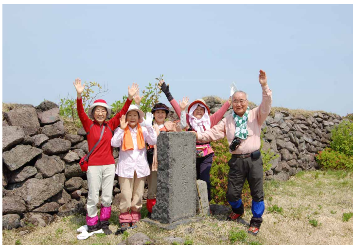
▲ 妙見山の山頂にて