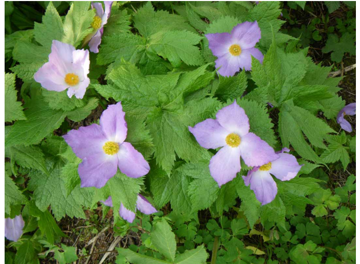
▲ 薄い紫が綺麗なシラネアオイ

花の種類・量ともに佐渡島 NO.1 のドンデン山周辺の散策を満喫した一日でした。