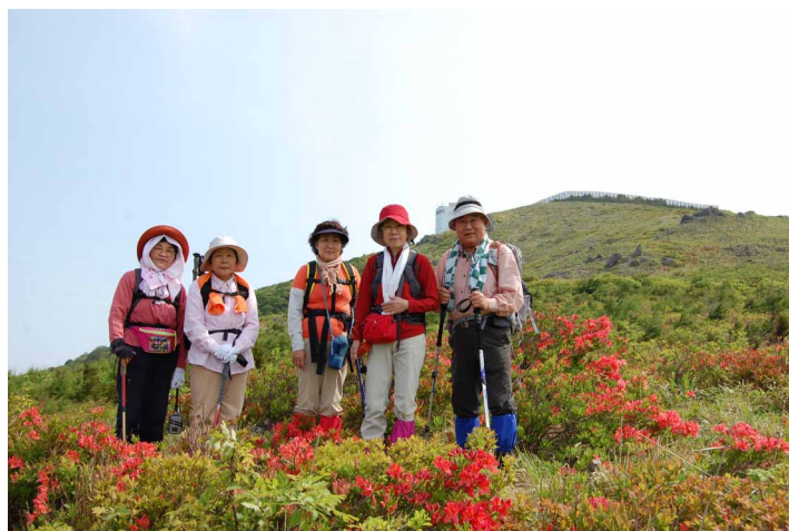
▲ 妙見山のツツジと一緒に

天気もよく、初めから終わりまで元気良く咲いた花づくめだった今回の山行きは「花の島・佐渡」を象徴するツアーになりました。