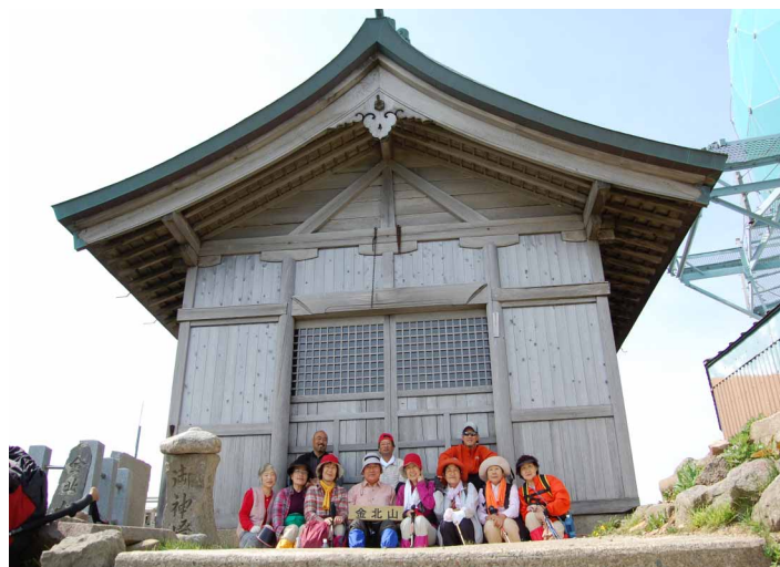
▲ 金北山の頂上にある社にて