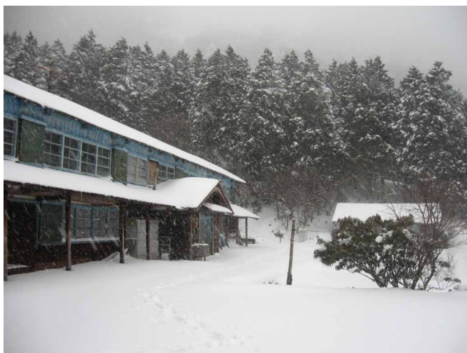
▲ 丸山荘はすっかり冬の世界

先週からどんどん押し寄せる寒波で、絶好の雪景色が楽しめる笹ヶ峰へいってきました。