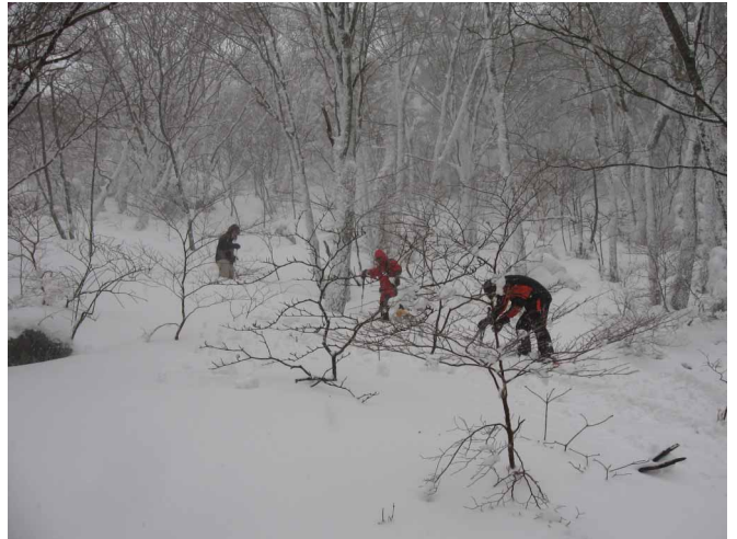
▲ フカフカの森林帯にてスノーシュー

06:00・今治発 08:00・林道登山口 08:40・宿 09:30・丸山荘 11:30・森林限界 12:00・丸山荘(昼食) 13:20・宿 15:00・林道登山口 17:00・今治着