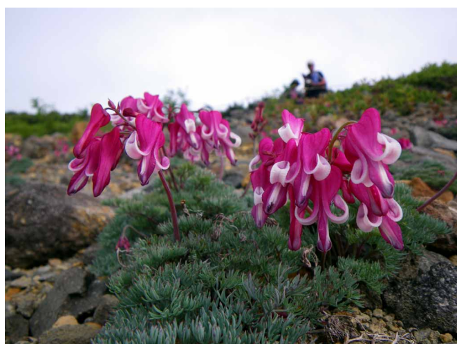
▲ 草津白根の満開のコマクサ

今なお噴煙を上げる浅間山、花を楽しめる四阿山、草津白根と百名山三山を歩いてきました。