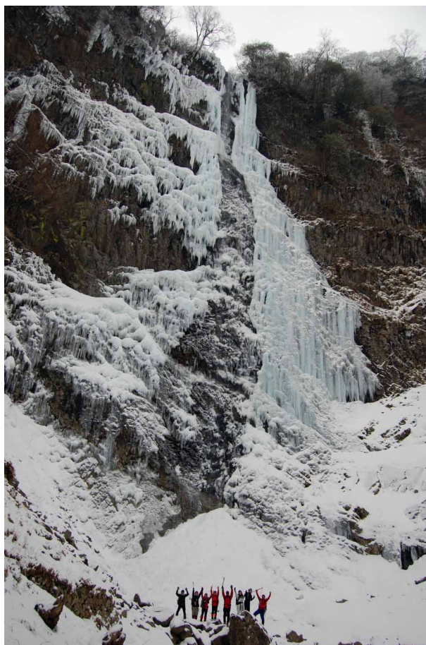
▲ 氷結した高瀑の滝のたきにてバンザイ

冬にしか見ることのできない、壮大な氷結した滝の景色を見てみよう、高瀑の滝へといってきました。