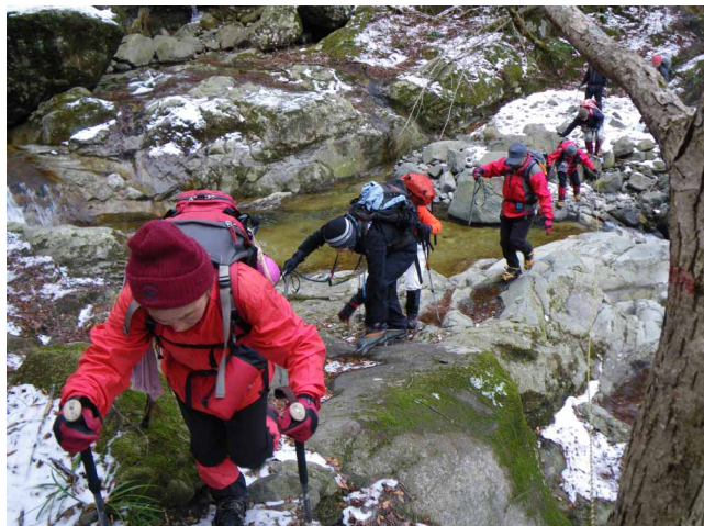
▲ 渡渉箇所は慎重に歩きます

05:00・今治発 07:00・御来迎橋広場駐車スペース 08:30・トンネル 09:20・高瀑登山口 10:40・丸渕 11:40・高瀑の滝(昼食) 13:40・高瀑登山口 16:20・駐車スペース 18:30・今治着