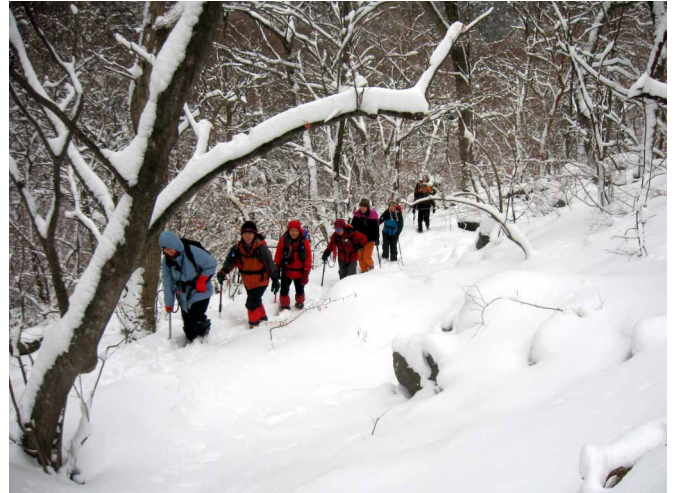
▲ 深い雪の中をがんばって登ります

06:00・今治発 08:00・御来迎橋広場駐車スペース 09:50・トンネル 10:40・高瀑登山口 12:00・のぞきの滝 12:40・丸淵(昼食) 15:00・高瀑登山口 17:00・駐車スペース 19:00・今治着