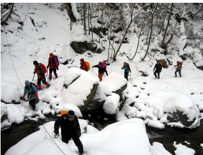
▲ 何度か渡渉しながら滝へ

冬には滝全体が凍り、見事な景色を楽しめる高瀑の滝へ絶景をもとめ行ってきました。滝まで行く林道は途中で崩落しているため、下の広場に車を止め林道歩きからスタート。昔の集落跡や素彫りのトンネルを抜け、登山口に到着です。前夜に多く降った雪のため、登山口からは深雪の中を登って行くことに、渡渉も何度かあり、気をつけながら滝を目指します。ずいぶん登山道も崩れた箇所があり、切れ落ちたトラバース道は慎重さも必要。しかし、崖の下には見事な滝があったり、ツララのカーテンがあったり、雪と氷に閉ざされた中で、素晴らしい景色を見せてくれます。そんな景色を楽しみながら丸淵へと到着。ここから45度はありそうに見える雪壁を登っていくことに、どんどんと増えていく雪に行き先を阻まれ、安全を考えてここまでとしました。なかなか、長く難しい道のりでしたが、寒さと雪の作り出す景色を楽しんだ山歩きでした。