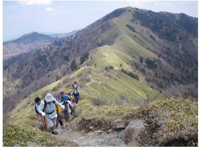
▲ 剣山から次郎笈への縦走路

05:00・今治発 07:30・美馬IC 08:40・見ノ越登山口 09:40・西島駅 10:50・剣山山頂 12:00・次郎笈(昼食) 13:30・大剣神社 14:40・見の越登山口 16:00・岩戸温泉 17:30・美馬IC 19:30・今治着