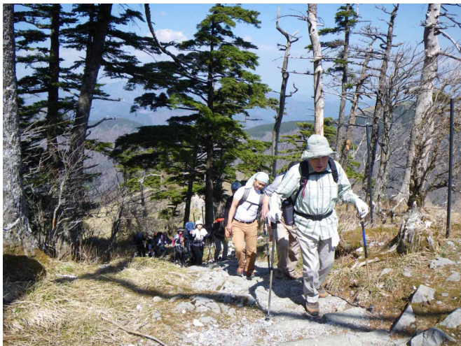
▲ 山頂目指して頑張ります