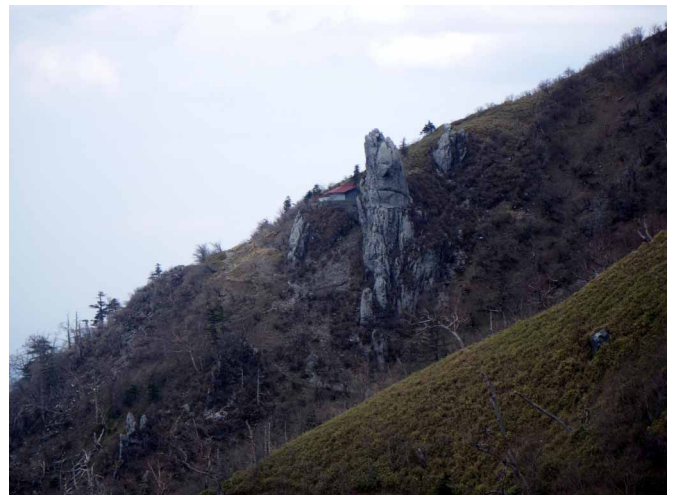
▲ 大剣神社のそそり立つ大岩