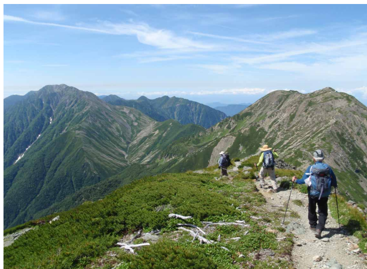
▲ 悪沢岳を越え赤石に向かって

05:00・起床、朝食 09:00・樫島ロッジ 11:30・畑薙ダム 25:00・今治着