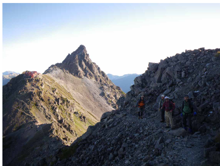
▲ 槍ヶ岳を背に大喰岳から

まずは上高地に入り、カップ橋から雄大な穂高連峰を眺めながら歩いて氷壁の宿「徳澤園」に一泊。