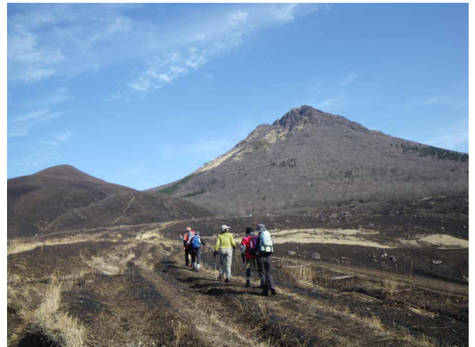
▲ 快晴の空の中、由布岳を目指して