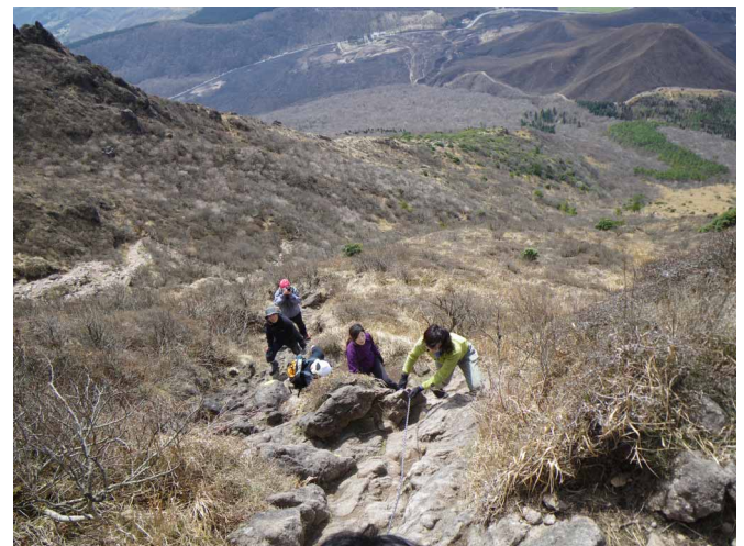
▲ 難所の西峰へのクサリ場を慎重に

大分を代表する由布岳と鶴見岳へ、春の気配と山頂からの360度の景色を楽しみにに行ってきました。