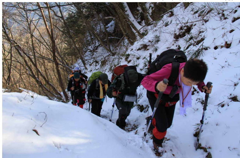
▲ シラサ山荘までの急登