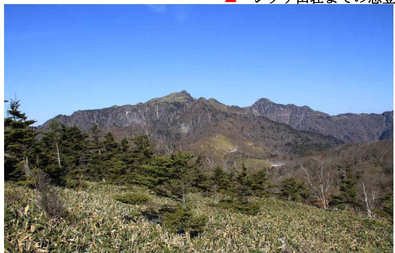
▲ 伊吹山山頂からの亀ヶ森方面

今回は今年最後の締めくくり登山と年明けの石鎚山の練習も兼ねて四国の伊吹山に行ってきました。登山口を出発して雪の積もった登山道をわさび田や氷柱をみながら進んで、シラサ山荘に到着。お昼ご飯を済ませて笹原を掻き分けながら伊吹山頂上に着きました。残念ながら？の快晴で霧氷は見れませんでした。締めくくりにはもってこいの気候の中でアイゼンを使った雪歩きを楽しむことができました。